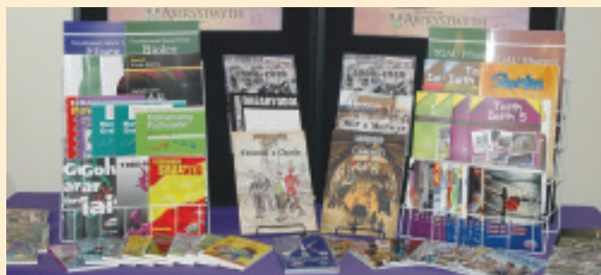
Yr holl ddeunydd a gyhoeddwyd gan CAA yn ystod 2007.