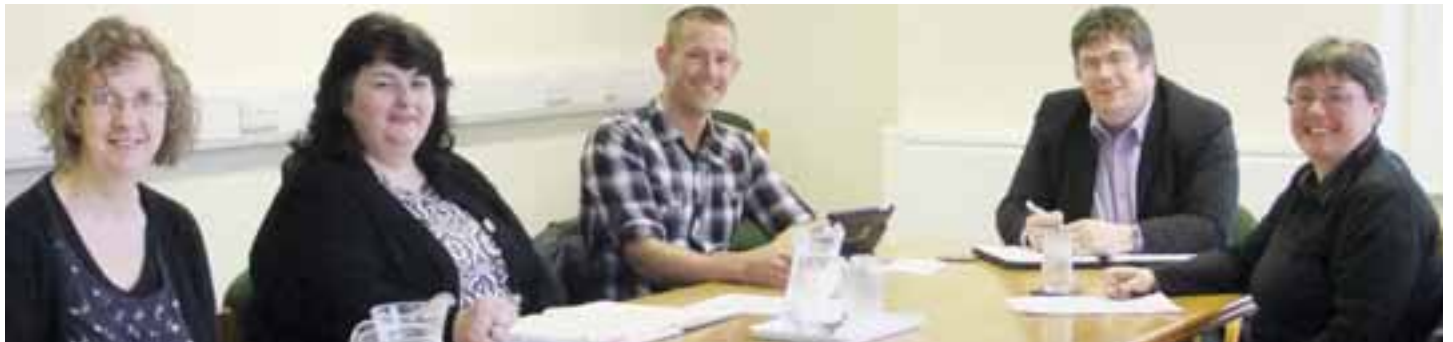
Gydag Adran Gydraddoldeb UCAC (Aberystwyth, 2013)