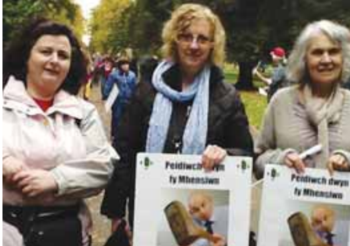
Yn Rali'r TUC 'Dyfodol sy'n Gweithio' (Llundain, 2012)

Yn niwedd 2019 bu i UCAC gollu un o'r haelodau ffyddlonaf, Siân Eira Cadifor.