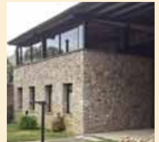
Y ddwy ystafell ddosbarth a ychwanegwyd yn 2015 – ar eu hanner, ac wedi cwblhau

Gymru fyddai'n gallu cynnig gweithgareddau amrywiol drwy gyfrwng y Gymraeg.