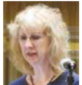
Yn annerch y Gynhadledd Flynyddol (Gwesty'r Celt, Caernarfon, 2010)

Rydym yn cydymdeimlo'n ddwys gyda'i theulu a'i ffrindiau.